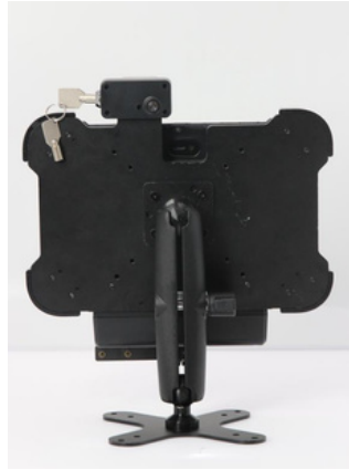
Soporte instalación fija