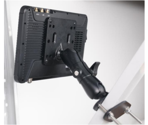
Soporte para vehículo