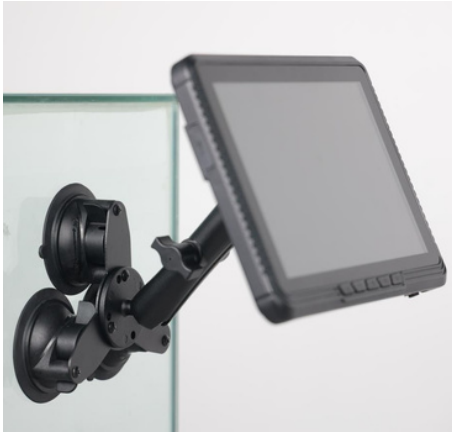
Soporte de ventosa